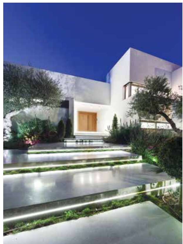
הכניסה לבית, שתוכנן בשנות השבעים, עם תוספת תאורה עכשווית.

המופרדים ביניהם במספר מועט של מדרגות, כשבעבר הפרידו ביניהם גם קירות. המדרגות נשארו, הורחבו ועוצבו מחדש בסגנון מודרני, אך עם זאת הוסרו הקירות, וכך נוצר קשר עין בין החללים המצויים במפלסים השונים שהפכו למעשה לחלל אחד תלת ממדי. שני המפלסים התחתונים נועדו לפעילות חברתית, במפלס האמצעי נמצא מטבח גדול שגבולותיו תחומים באמצעות הנמכת תקרה ואי פינתי המשמש גם כדלפק אכילה. פינת האוכל הצמודה נועדה גם למתארחים בגינה, ופינת הישיבה בסלון גם היא פונה לעבר הבריכה. במפלס התחתון מוקם חדר המשפחה, ובמפלס העליון חדרי השינה שבכל אחד מהם נפתחו פתחים גדולים הצופים לעבר הבריכה. דגש רב הושם לטובת פיתוח החצר האחורית שבה ניכרים שלושה אזורים המופרדים ביניהם במרקמים שונים. ביציאה מהסלון, ברחבה המקבילה לפרגולה הבנויה, ממשיך הריצוף שבתוך הבית, בהמשך הרחבה המובילה לאזור האירוח החיצוני, נבנה דק מעץ ולמשטחים סביב הבריכה מראה של אבן. בקצה הדק מוקם מטבח חיצוני הכולל עמדת ברביקיו גדולה, מקומות אחסון, מקרר מיוחד לחוץ וכיור. לנוחיות האורחים והמשתמשים בבריכה תוכנן חדר רחצה נפרד עם כניסה מן החוץ. ■