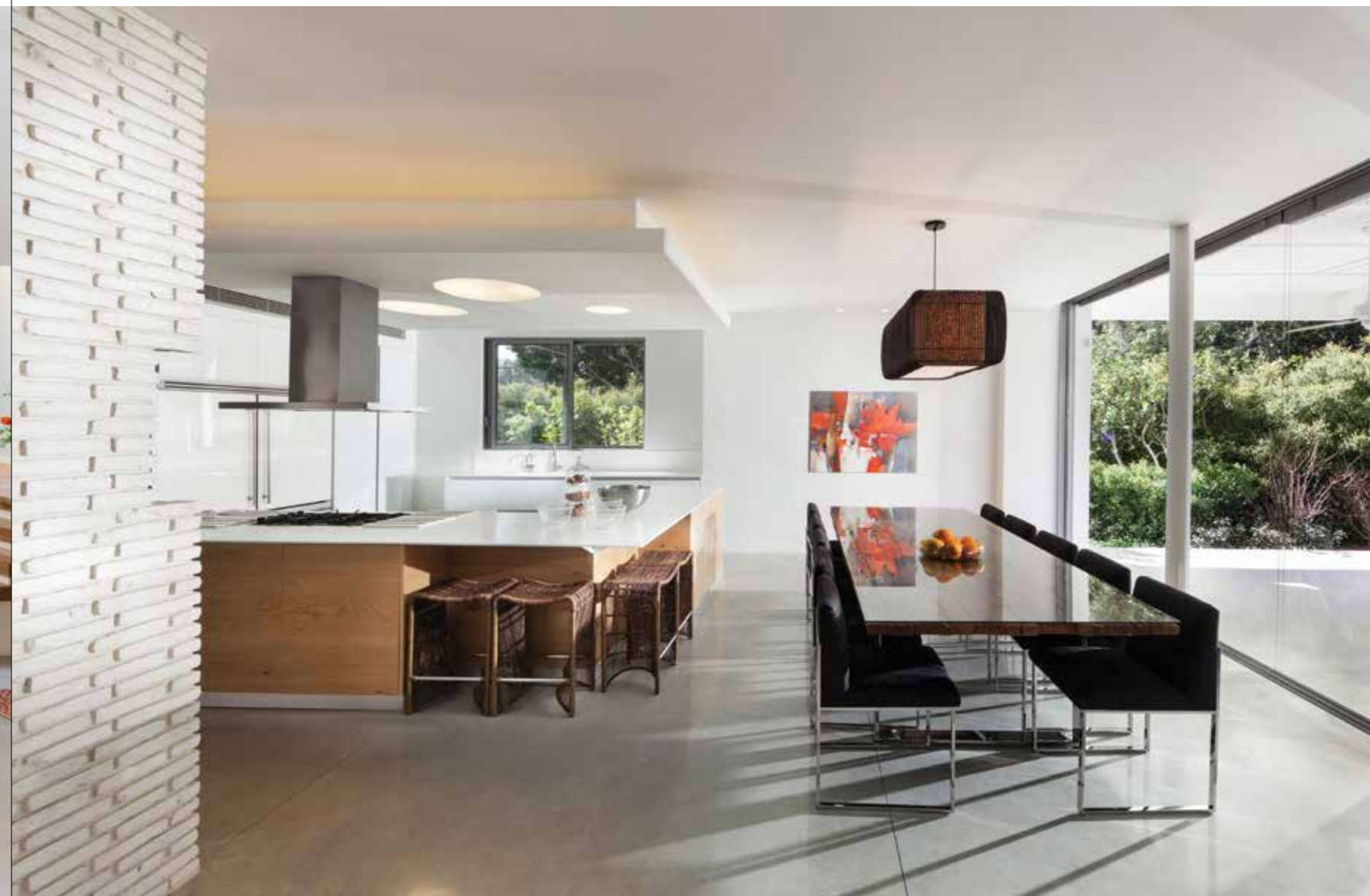
ריהוט: "סיאם", שטיח: "שטיחי איתמר", ציורים: גלריה דנארט.